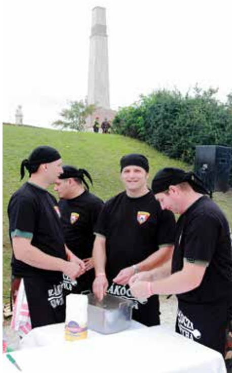
Lehet, hogy meglepő, de ez itt a csipet-csapat: éppen csipedik a tésztaát a rottyó bagulyáshoz