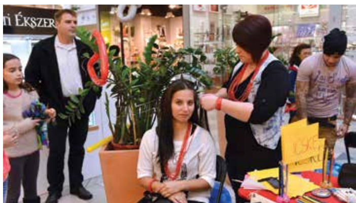
A civil nap célja a közösségépítés és a civil tevékenységek széleskörű megismertetése

„Ez a nap rólunk, emberekről szól. Azokról az értékekről, amelyeket együtt képviselünk, teremtünk.