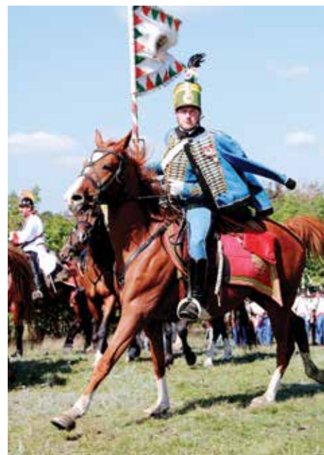
A zászló azon a napon mindennél fényesebben lobogott