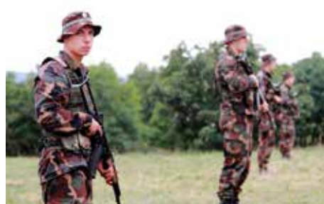
„Szabadság, szerelem! / E kettő kell nekem. / Szerelmemért fölláldozom / Az életet, / Szabadságért fölláldozom / Szerelmemet.”