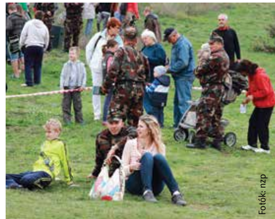
A magyar honvéd mégis családjával érzi magát a legjobban!