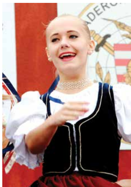
Amíg a férfiak harcba mennek, az asszony nép táncsal várja haza őket