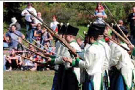
Sok honvédő szinte elszállóként indult a pákozdi dombok közé

Szombaton a szárazföldi haderőnem különleges alakulatai tartottak látványos bemutatót, harcokcsi- és fegyverbemutatót, miközben a lányok táncra szólították egymást s az ifjakat. A gasztronómiai program sem maradhatott el, mert a magyar baka szeret enni csata előtt és csata után egyaránt. Vasárnap a nagyközönség előtt játszották újra az 1848. szeptember 29-i csatát a huszár és katonai hagyományörzők. Hangosbeszélőn tudatták a nézőkkel, miként folyt le a híres ütközet, amely végén Jellasics és serege Bécsig menekült.