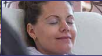
A kétarcú stressz 10. oldal