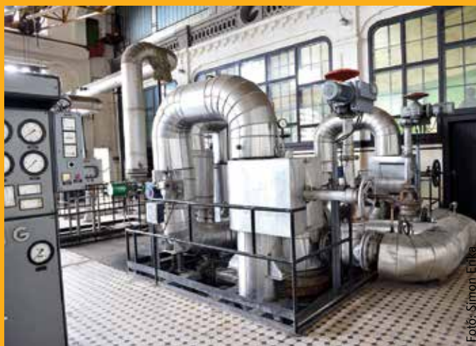
Szeptember 15. óta már kérhető a távfűtés

A szeptember 15. és október 15. közötti időszakban a fűtés elindítását az arra jogosult személy kérheti. A társasházi közös képviselőnek, a lakásszövetkezetnek vagy a fűtési megbízottnak írásbeli kérvényt kell benyújtania, és a bejelen-