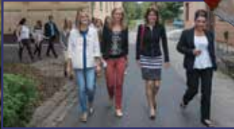
Gyógyítás testközelből 9. oldal