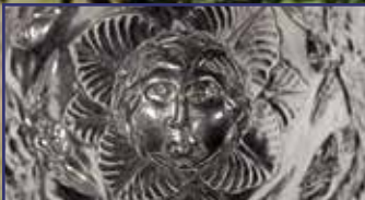
Indul a visszaszámlálás: péntektől Fehérváron a Seuso-kincs! 14-17. oldal