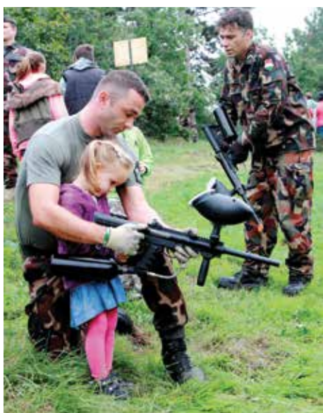
Mondják, nem lehet elég korán kezdeni, még ha szűnes kis zacskók röpdülnek is ki abból a csúnya fegyverből