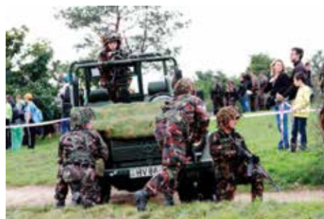
A bemutón az utat a szolnoki alakulat különleges osztaga biztosította