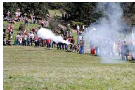
A honvéd ösztűz és a bazaszeretet futásra kényszerítette az ellenséget