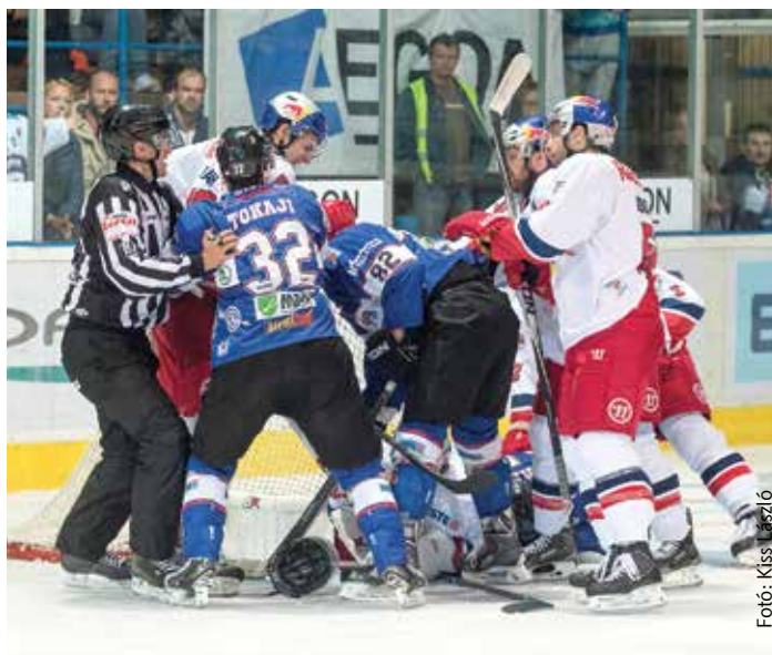
Ezúttal a Bikák keményebbek voltak az Ördögöknel