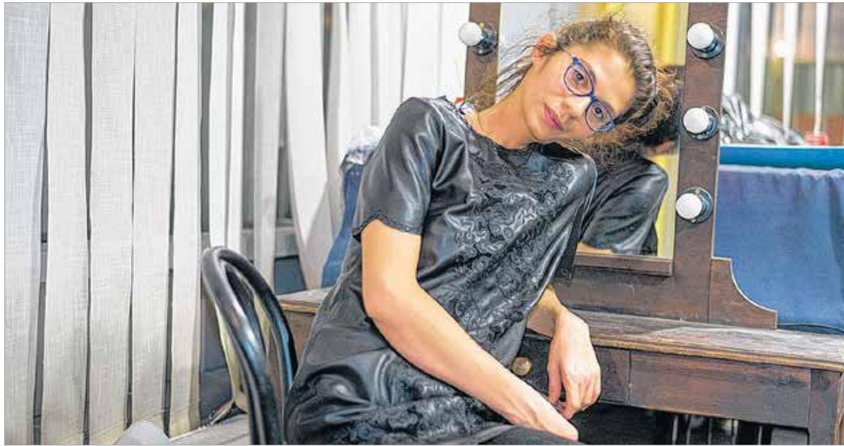
A színházi öltöző magányában

gátlásokkal küzdő ember szabadságvágyát, teszi ezt burjánzó színekavalkáddal ábrázolt emberekkel – embereknek.