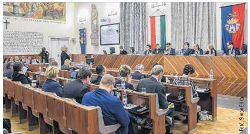
Idén a tavalyinál több pénzből gazdálkodik a város

A városatyák döntöttek arról is, hogy Székesfehérvár csatlakozik a 2024-es olimpiai és paralim-