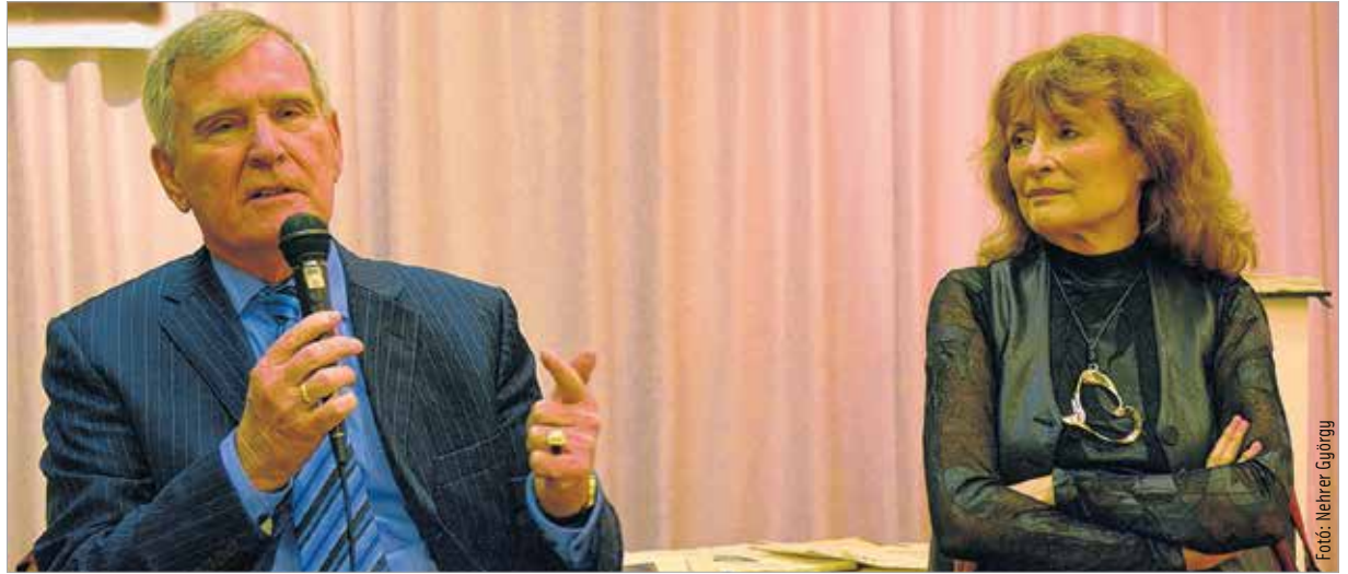
A keresztényellenesség mindennapos jelenség Európában is