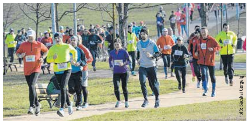
Negyedszer rendezték meg a Valentín-napi jótékony célú futást a fehérvári Halesz parkban. Több mint kétszázan teljesítették a kettő vagy hét kilométeres távot. A résztvevők az Arany János Iskola alapítványa javára adományozhattak.