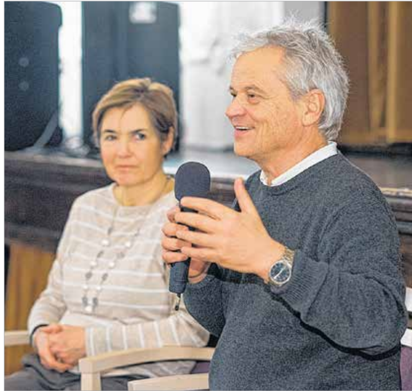
A mosoly és a tisztelet átsegít a nehézségeken

Tabuk nélkül hallhattunk a házasság szentháromságának misztériumáról, a szeretet, a hűség és a megbocsájtás bizalmi elvének természetességéről és a konfliktuskezelés emberi egyensúlyának megteremtéséről. Mindez megannyi megerősítés, amely létünk alapja – emelte ki előadásában, Csókay András: „Ugyanolyan fontos, hogy a szeretetáramlás megvalósuljon Isten és ember között, mint ahogy az emberek és közttem. A házasság az, amiben a legjobban lehet