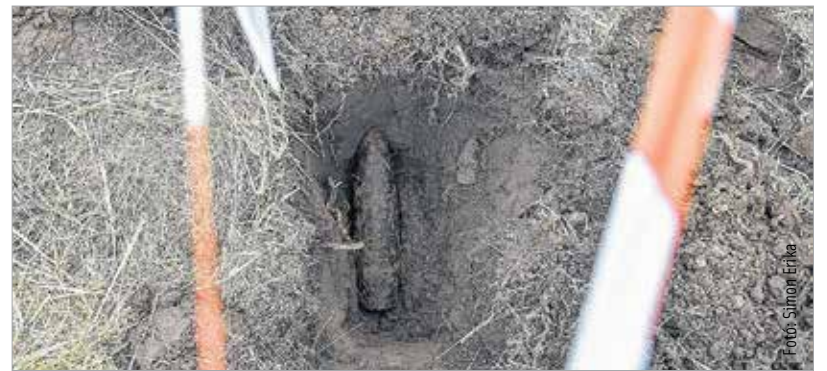
A lőszerfelmérés március végéig tart. A természetvédelmi terület addig nem látogatható.