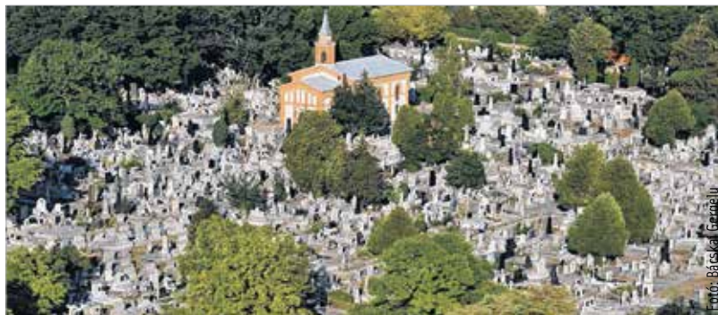
A vizsgálatok és a sírásók egybehangzó véleménye az, hogy négy fehérvári temetőben már csak urnás temetéseket szabad végezni. A soron következő városi közgyűlés kezében van a döntés.

A Béla úton még nagyon sok szabad terület van az önkormányzat tulajdonában, de vannak tartalék területek is. Így aki mégis ragaszkodna a koporsós temetéshez, nagy valószínűséggel a Béla úton vagy a város további fél tucat temetőjében tud majd temetkezni. Az ügyről eddig a szakértői vélemény készült el, a döntést a következő fehérvári közgyűlés hozhatja meg.