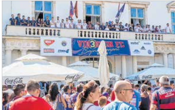
Az ünnepség a szálloda teraszán folytatódott