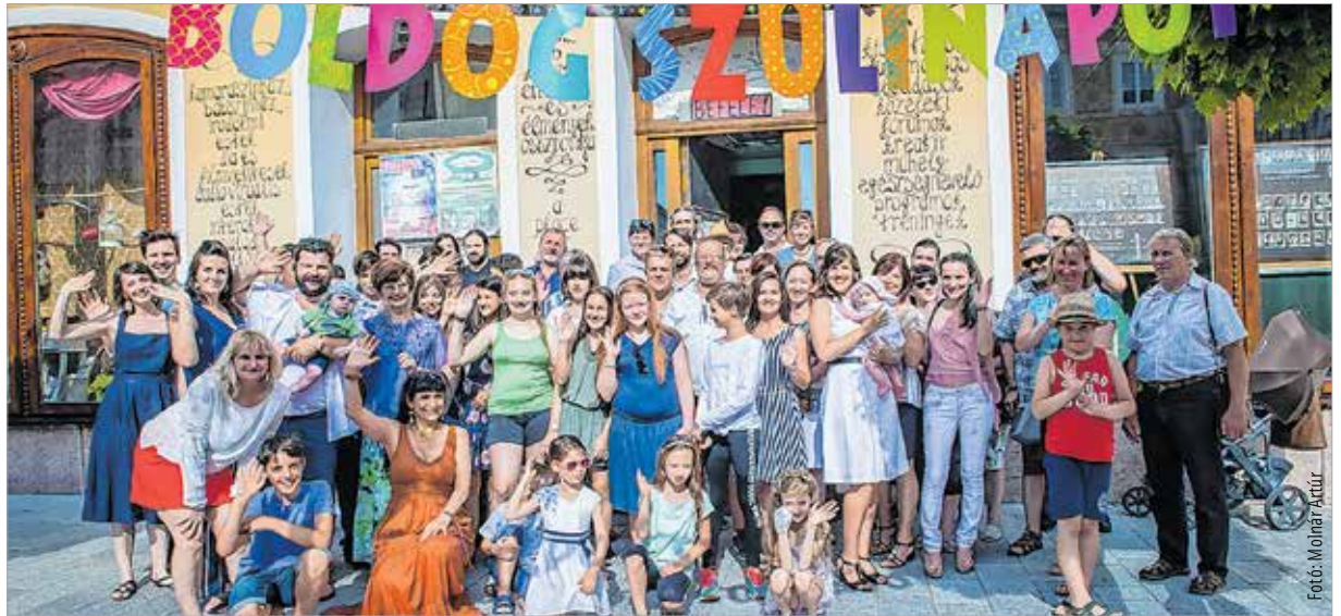
Hatvan év, négy generáció

Az utóbbi tíz év jelentős változást hozott a Szabad Színház életébe. Előbb filmes, majd bábszínházi tagozat alakult, négy éve pedig megkezdődött az iskolarendszerű utánpótlás-nevelés. Ennek lehetnek tanúi azok, akik a fiatalok előadásait választották szombaton. A Szabad Színház az elmúlt hatvan évben megannyi fajsúlyos irodalmi művet dolgozott fel, több ezer előadást tartott, melyeket több tízezer néző látott. A háromnapos programkavalkádon az egykori és mostani