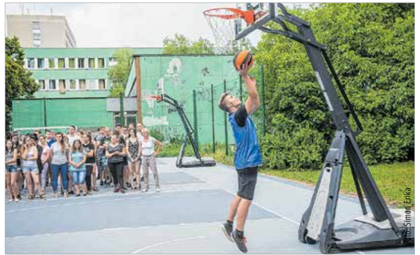
A pályát ingyenesen lehet használni