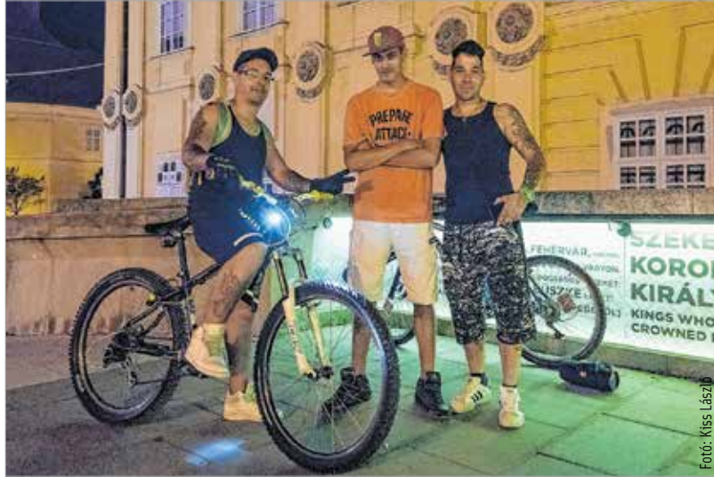
Ezek a srácok ugyan szeretnek bulizni a belvárosban, de tudják, hol a határ

„Elkeserített már minket ez a hely.” – kezdi egy tizenhét év körüli lány az Ország-álmá melletti padon ülő társaságból. Öt-hat fiatal, fiúk-lányok vegyesen: sör, cigaretta, pesszimizmus. Szerintük Fe-hérváron nem lehet bulizni. Nemcsak a bulihelyek szűkös választéka miatt, hanem mert nem érzik magukat bizton-ságban. „Az Alba Bár az egyetlen, ahová el lehetne menni, de az meg tele van kétes elemekkel.” – folytatja egy hasonló korú fiú. „A köztereken sem túl biztonságos, mert van egy jól kiterjedt bandahálózat. Úgy tudom, a Hübnerről jönnek be, ők egyszerűen ellehetetlenítik a szórakozást. Akárhova megyünk, mindenhová jönnek utánunk. Drogot kínálnak, pénzt követel-nek.” – meséli a lány. „A rend, az egy fon-