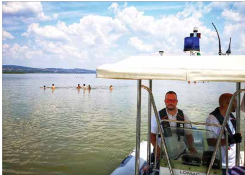
Korán kezdődött a szezon, a tó vize kiváló és már huszonhat fokos, így egyre többen fürdenek benne