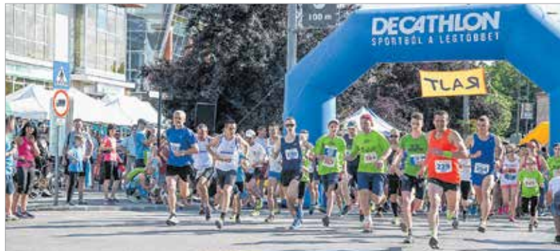
Az idei TESZ-futás is elérte célját, a sportos és környezettudatos életmód propagálását