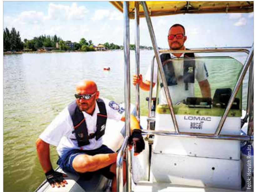
A gárdonyi vízi rendőrök tapasztalt szakemberek, akik jól ismerik a Velencei-tavat

A rendőrök folyamatosan járőröznek a nyári szezonban, hogy ha szükséges, segíteni tudjanak. Három hajóval látják el a tizenkét órás szolgálatot és az éjszakai készenléteket. Mindhárom motorcsónak más-más típusú, egyikkel például fürdőzőkhöz, másikkal csónakhoz, a harmadikkal pedig vitorlás mentéséhez sietnek.