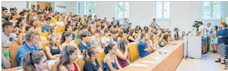
A diákok játékos környezetben pillanthatnak bele az egyetemi világba

A Tudástőzsdé programon Mészáros Attila is megszólította a diákokat. Az alpolgármester elmondta: a tanulók számára komoly diplomát tud biztosítani a Corvinus Egyetem, mely három éve van jelen a városban, és hallgatói létszáma, duális képzési kínálata egyre növekszik. Az intézmény ezért új épülettel bővül, mely a következő tanulmányi évtől már fogadni tudja a hallgatókat.