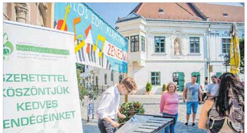
A futáson túl a családokat tánczazzal, hangszerkiállítással és fajátékokkal várják