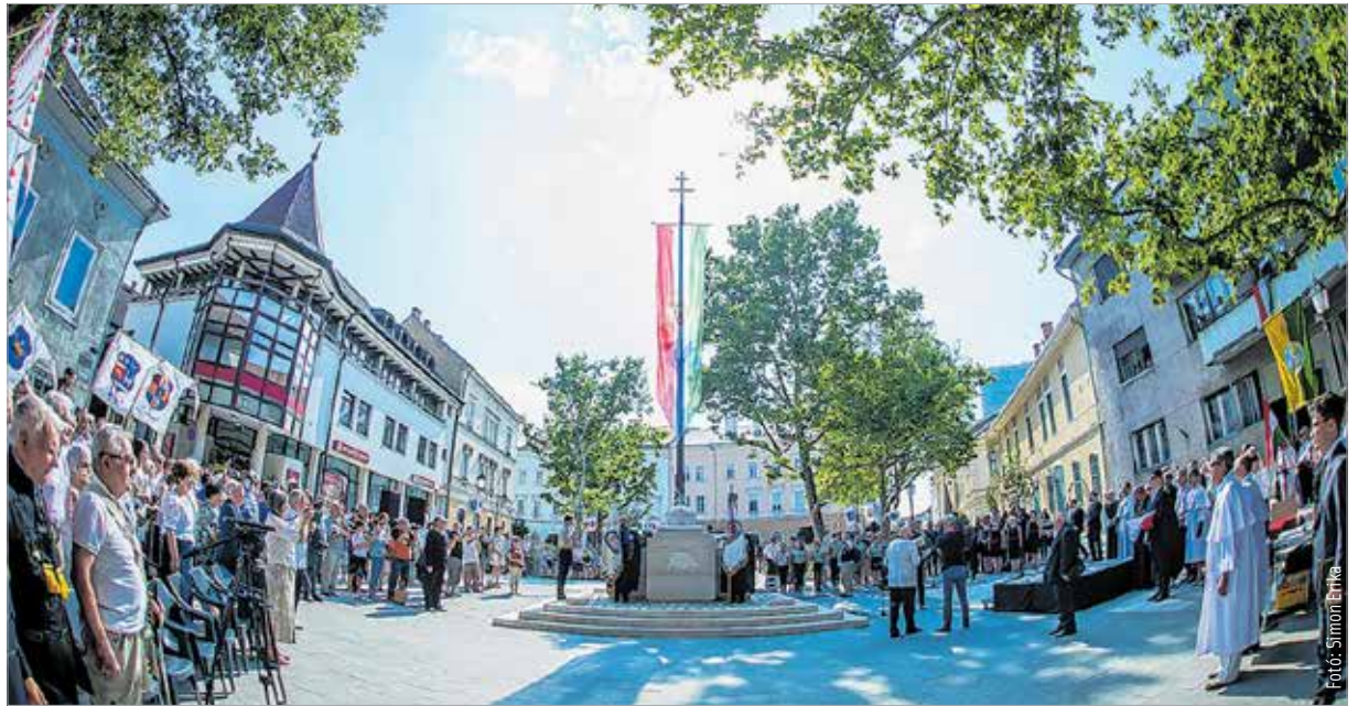
A zászló talapzata a hatvannégy vármegye földerekléjét rejtí