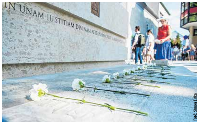
A vármegyék örökbefogadói egy-egy szál fehér szegfűvel rótták le tiszteletüket az emlékműnél

átadták a társadalmi összefogás nemzeti lobogóját Székesfehérvár polgármesterének és az Országzászló Védnöki Testületnek. Ezt