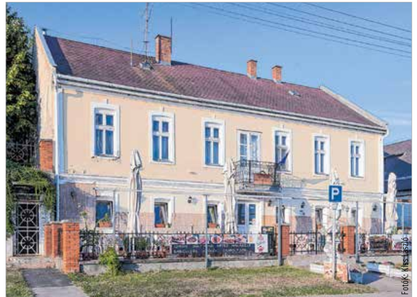
Az egyik Wickenburg-kúria ma a polgármesteri hivatalnak ad otthont, a másiktól étterem lett

asszonyoknak számított. Özvegy édesanyja ápolása felemésztette fiatal éveit. Kossuth Lajost 1837-ben letartóztatták a zugligeti Disznófó-forrás feletti tisztáson, mert a betiltott Törvényhatósági Tudósításokat továbbra is megjelentette, amiért egy ellene lefolytatott hűtlenségi perben négy év börtönbüntetésre ítélték. A börtönök alatt húga, Kossuth Zsuzsanna és Meszleny Teréz voltak szorgalmas látogatói. Kossuth 1840-ben általános közkegyelem folytán szabadult. Parádra utazott, hogy felerősödjék. Meszleny Teréz hűségesen látogatta tovább, mígnem egy alkalommal menyasszonyként tért haza. És eljött az ő nagy napja: 1841. január 9-én, miután a Pesti Hírlap szerkesztőjeként Kossuth biztos állást kapott tervezhető, tűrhető jövedelemmel, az asszonytársadalom rangjára emelte kitaró, hűséges menyasszonyát. Az anyakönyvben Teréz korát huszonegy évesnek vallották, hogy fiatalítsák. A kortársak fintorogtak. Meszleny Teréz zárkózott, rátarti és unalmas nő volt a szemükben. Hidegnek,