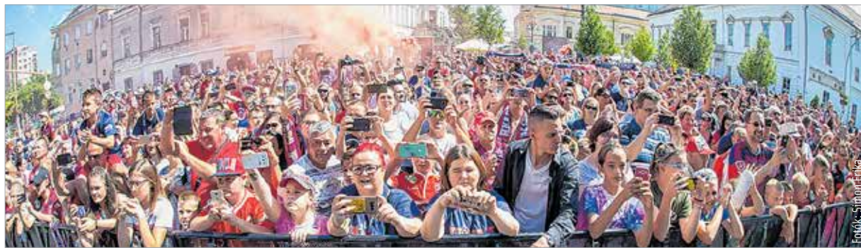
Nagyon sokan jöttek el vasárnap, hogy együtt ünnepeljék a csapattal a harmadik bajnoki címet