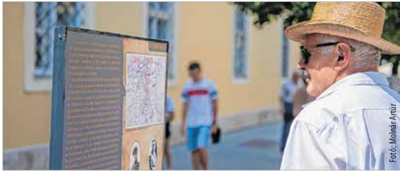
A táblókiállítás nagy hangsúlyt fektet a fehérvári ezredek részvételével zajló harcok bemutatására

A június elsején nyílt táblókiállításán többek között a Kerenszkij-offenzíváról, a cári orosz és a román hadsereg összeomlásáról írnak bővebben. De betekinthetünk a keleti, galíciai front harcait véglegesen lezáró békeegyezmények körülményeibe, melyeket 1918-ban Breszt-Litovszkban és Bukarestben írtak alá az egymással háborúban álló hatalmak képviselői. A tárlat nem feledkezik meg a Székesfehérváron állomásozó vagy a városhoz szoros szálakkal kapcsolódó ezredekéről sem, a kiállítás és az összefoglaló kiadványokban is megemlékeztek a császári és királyi 10. és 13. huszárezredről valamint a magyar királyi 310. honvéd gyalogezred háborús szerepléséről.