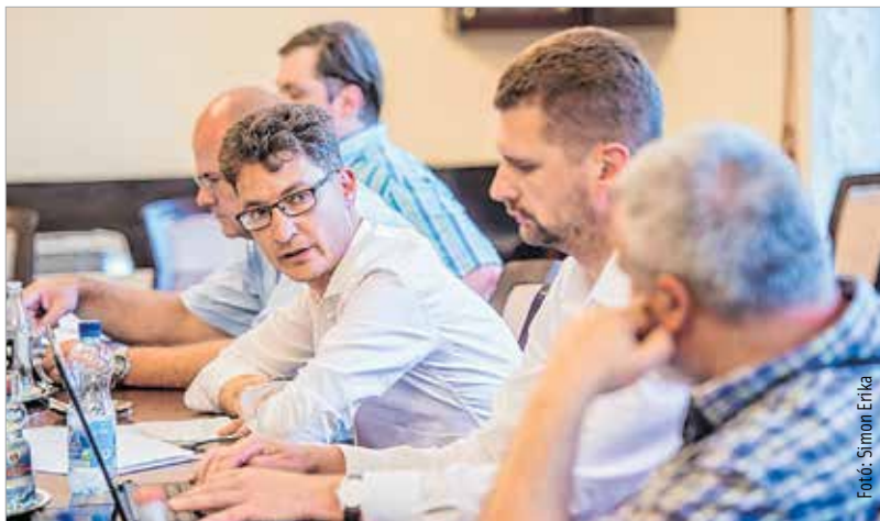
Az online fogadóórán megvalósításra váró ötletek is érkeztek

Sokan érdeklődtek a veszélyes állapotban lévő Vörösmarty tér 12. számú épület sorsáról is, amiről megtudhatták, hogy az épületet – felújítási kötelezettséggel együtt – egy magánbefektető megvásárolta az önkormányzattól, így várható, hogy a felújítás megtörténik a következő években. A Vásárhelyi út