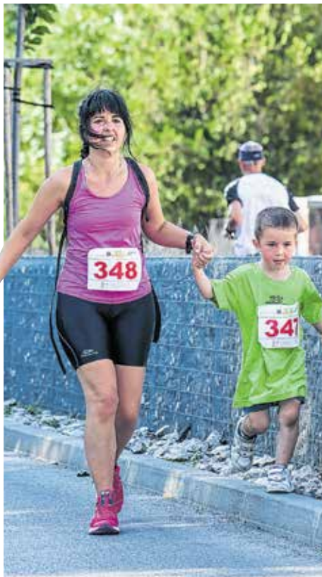
Mint mindig, családok programja is volt a VII. TESZ-futás

A TESZ-futás szervezői előnevezési lehetőséget is biztosítottak, de a helyszínen is nagyon sokan akartak jelentkezni június első vasárnapján. Hivatalosan 1.6, 4.8 és 9.6 kilométeres távokat lehetett teljesíteni egyéniben vagy családi, munkahelyi csapat tagjaként. Jól járhattak azok az iskolák, akiknek a nevezők futásukat „ajánlották”, hiszen sportszervásárlási utalványt kaptak az aktivitás függvényében. A leghosszabb távon indulók heroikus küzdelmet folytattak a nagy melegben, de kevesen adták fel menet közben. A Depónia-futásnak hagyományosan inkább demonstratív célja van: a szelektív hulladékgyűjtést népszerűsíti. Persze ezen az egykörös távon is volt, aki végigspurtelt!