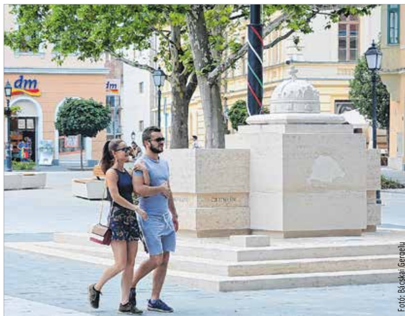
A fehérváriak már birtokba vették a megszépült teret

plusz egy vármegyei jogú város, Fiume jelképes örökbefogadóinak. Ezután a lovagrendek és vitézi rendek kíséretében ünnepélyesen