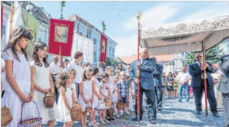
Az ovisok és a kisiskolások virágszőnyeggel díszítették az Oltáriszentség útját

körmenetben viszik ki a hívek jelenlétében az Oltáriszentséget. A Ciszterci Szent István Gimnázium tanulói, a Szent Imre Általános Iskola és Ovoda diákjai és óvodásai, a hittanosok, cserkészek virágszirmokat szórva, a plébániák képviselő-testületének tagjai pedig zászlókkal vonultak a belváros utcáin, hogy együtt fejezzék ki tiszteletüket Jézusnak, aki az üdvösség eledeleként és italaként ajándékozta önmagát minden embernek.