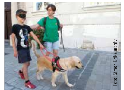
A résztvevők átérezhetik, milyen fogyatékkal élni