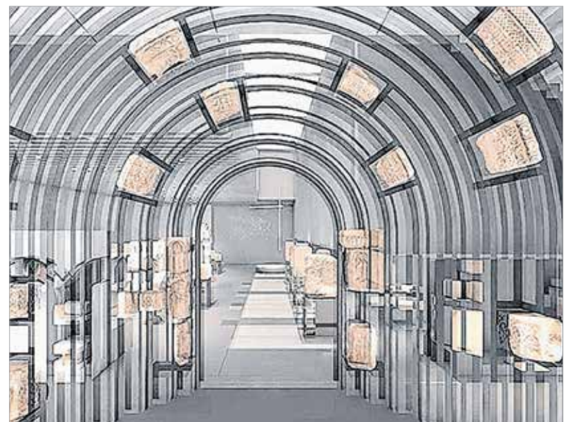
Így mutatják majd be a valamikori koronázobazilika megmaradt köveit a bazilikatörténeti kiállítóhelyen

A beruházás az Árpád-ház-programban betöltött helye mellett egy korábbi ígéret megvalósulását, a volt Köztársaság mozi épületének megmentését is jelenti. Az 1937 és 39 között Hübner Tibor tervei alapján épült egykori Alba, majd Köztársaság mozi és bérház ma már rendkívül rossz állapotban van. Így elsőként a pince és az afölötti födém megerősítése illetve a beázásmentesség biztosítása miatt a tető megerősítése kerül sorra. A belső terek is teljesen átalakulnak majd, és kiegészítő parkolók is létesülnek a központ látogatóinak jobb kiszolgálására. Az egykori moziépület belmagasságát kihasználva létesül egy különleges kiállítóter, mely huszonegyedik századi technikai megoldásokkal lehetőséget ad az egykori bazilika tömbjének bemutatására: a megmaradt kövek és az azok kiegészítésére szolgáló installációk révén ismerhetik meg a látogatók a Székesfehérvár történelmében oly fontos Szent István-i korszakot.