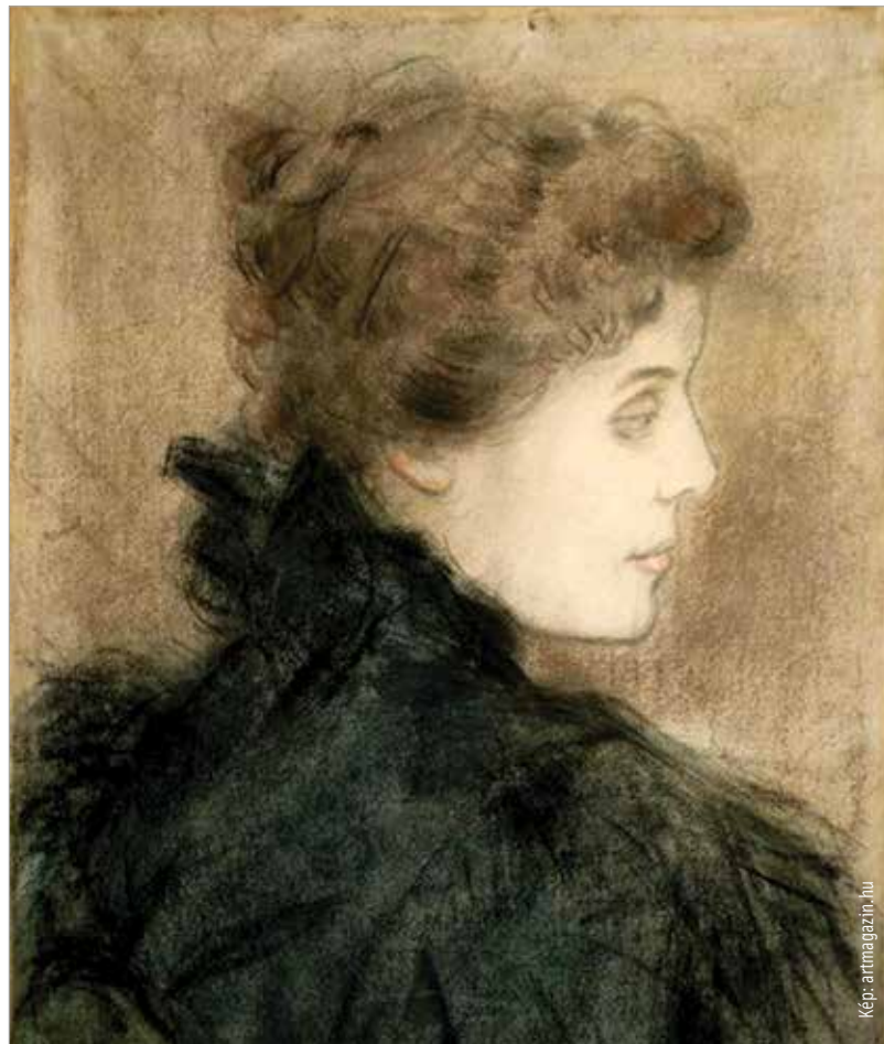
Rippl-Rónai József: Gróf Andrassy Tivadarné Zichy Eleonóra portréja (1896)

A kiegyezés évében született. Alig múlt tizennyolc éves, amikor a kegyeiért tolongó ifjak közül a „szép akasztott” id. Andrassy Gyula idősebb fia, Tivadar nyerte el a kezét. És akkor kiderült, hogy nem áll készen az asszonyi lét testiségi oldalának megtapasztalására. A rá váró szüléseket is megalázóan tartotta. Talán azért bánt szigorúan, majdhogynem kegyetlenül leányával, hogy büntesse őket női létükért. Feltűnő távolságtartással viszonyult gyermekeihez. Az úri társaság visszaemlékezései szerint a vendégeket is kínos helyzetbe hozta azzal, ahogyan jelenlétükben bánt a gyermekeivel. A lányokat alulöltöztette, a legnagyobb hidegben is lenge ruhát adott rájuk, kesztyűt, harisnyát nem viselhettek, egyfolytában fáztak. Jéghideg patakban kellett futniuk mezítláb valamiféle kúra jegyében. Csak a szobáikban étkezhetek elkülönülve. Híre ment a nádpálca gyakori használatának is. Prúd édesanyjuk betegesen féltette leányait a könyvekben megírt érzelmek megismerésétől: a klasszikusok kötetiben áthúzta azokat a sorokat, amelyeket nem olvashattak el, összevarrta azokat a lapokat, amelyek bármilyen érzelmekről szóltak. Valószínűleg a gyermekkori traumák