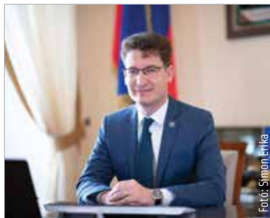
Folytatja polgármesteri munkáját Cser-Palkovics András

Kiemelte: amióta polgármester, minden egyes országos választás előtt felmerül a városi közbeszédben, hogy indul-e a parlamenti székért, várja-e az országos politikában valamilyen tisztség vagy megbízás, mely félbeszakítja a polgármesteri munkát. Mint mondta, 2014-ig jelen volt az országos politika frontvonalában, és pontosan ez az a tapasztalat, ami alapot és felhatalmazást ad arra, hogy a helyi és országos közélet elválasztása mellett teljes erővel kiálljon: „Pontosan látom, hogy az önkormányzat, ez a néha lenézett, de gyökereiben sok száz éves intézmény mire képes, és mennyivel nagyobb teljesítményre hivatott, mint amire az országos politika vagy néhány politikus-társam tartja. Akadnak, akik pusztán sznobizmusból vagy arroganciából néznek át az önkormányzatok felett, de ami sokkal veszélyesebb, hogy vannak, akik csupán az ambícióik, a politikai karrierjük egyszerű eszközeként tekin-