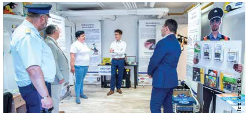
A központ munkájának fókuszában a prevenció áll

Varga Péter dandártábornok, a Fejér Megyei Rendőr-főkapitányság vezetője kiemelte: egy olyan komplexum került átadásra, mely azt a célt szolgálja, hogy minél több állampolgárt tudjanak megismertetni a bűnmegelőzés alapjaival, az óvodáskoruktól a nyugdíjasokig.