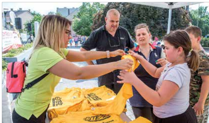
A Depónia-futam teljesítői ajándék pólókat kaptak