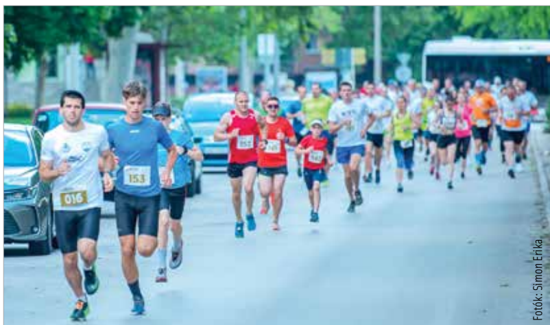
Idén is sokan húztak futócipőt