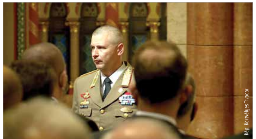
Ruszin-Szendi Romulusz vezetésével folytatódik a Magyar Honvédség átalakítása és fejlesztése

tábornok vezetésével eddig elvégzett munkáért, mely megeremtetette az alapját egy korszerű eszközökkel felszerelt, ütőképés haderőnek. Eredményesen hajtotta végre a Magyar Honvédség parancsnokságának megalakítását, megkezdte a NATO-parancsnoksági struktúrába illeszkedő székesfehérvári Közép-európai Többnemzeti Hadosztály-parancsnokság létrehozását. A kormányfő hangsúlyozta: az új parancsnok feladata, hogy a hadsereget – fegyelmezett belső rendje és a katonaszemélyek megőrzése mellett – beillesse a társadalomba, nyerve meg, készítse fel, képezze ki a fiatalokat a haza védelmére és a katonaszemélyek tiszteletére.