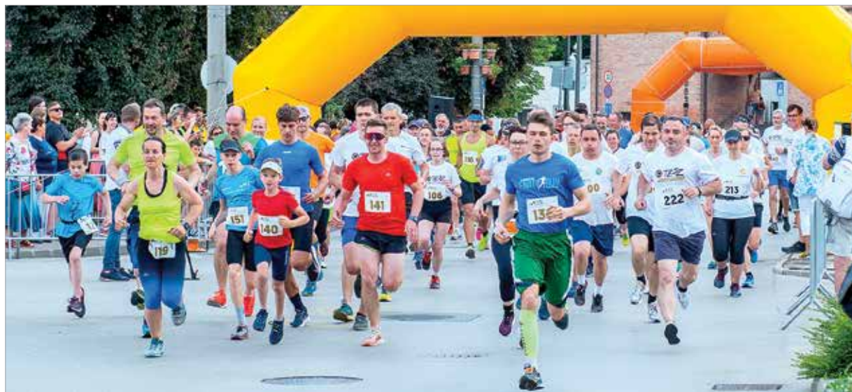
Tizedik alkalommal futhattak a vállalkozó szelleműek egészségükért és környezetükért