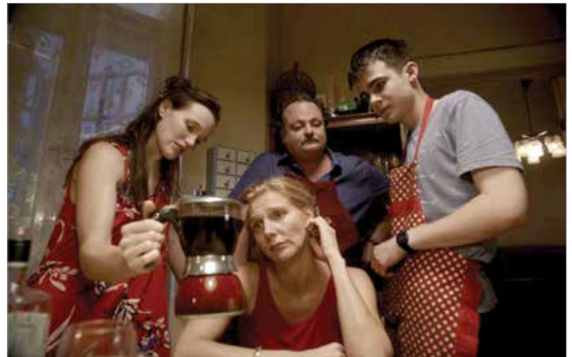
Jelenet a Hét kis véletlen című filmből

nagyon sokat forgatott filmszalagra. És akkoriban rituálé volt, hogy minden forgatási nap után a rendező és a vágó a legelső vágatot, az úgynevezett mustert megnézik a vetítőben. Ez most már digitális formában, de továbbra is szokás maradt, és minket is meghívtak esténként ezekre a vetítésekre. Így már az elejétől kezdve szokhattam magamat a vásznon, de a mai napig nem