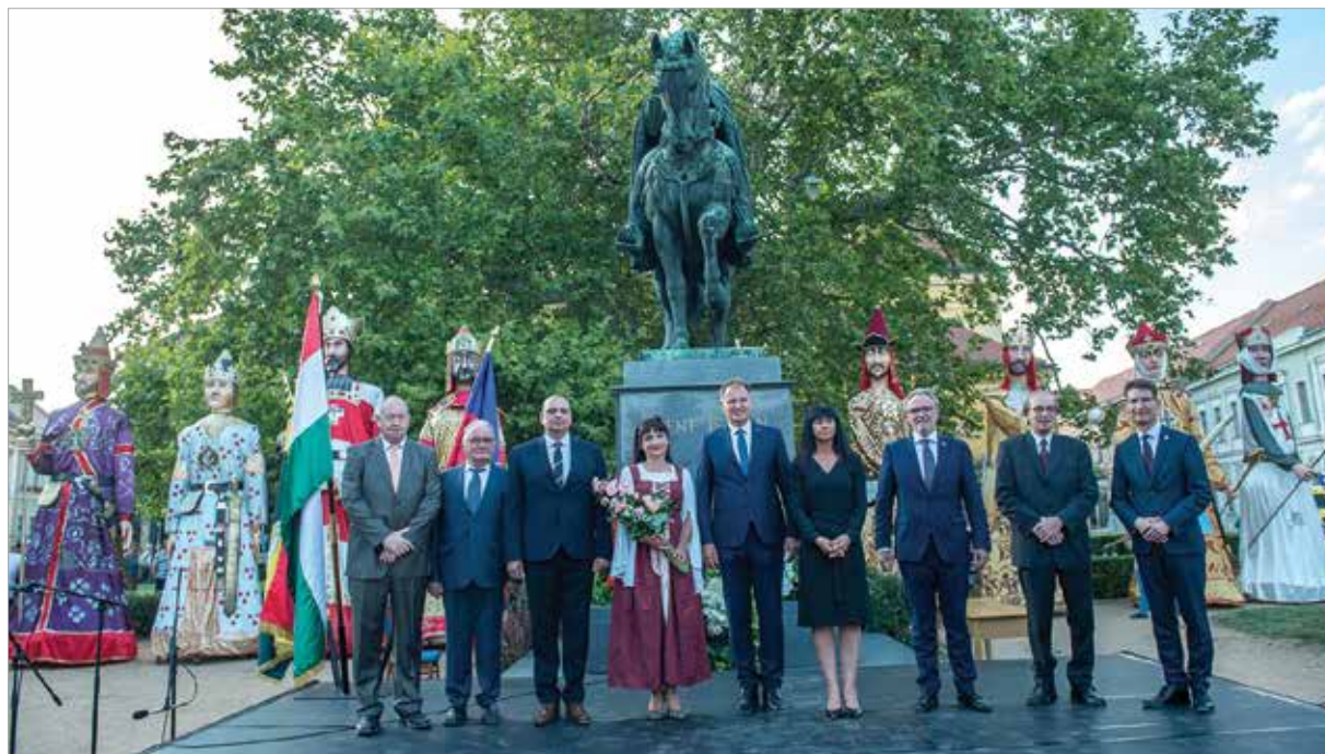
Együtt a díjazottak