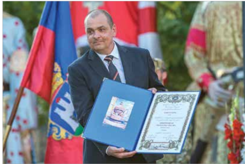
Korom Ferenc vezérezredes is városunk Tiszteletbeli Polgára lett

A város és a honvédség közti társadalmi kapcsolatok terén végzett munkája elismeréseként Székesfehérvár önkormányzata Székesfehérvár Tiszteletbeli Polgára kitüntető címet adományozott Korom Ferenc vezérezredesnek, a Magyar Honvédség korábbi parancsnokának, valamint a Székesfehérvár és Schwäbisch Gmünd közötti kapcsolatok ápolása, fejlesztése, valamint a kulturális értékek megőrzése érdekében végzett tevékenysége elismeréseként Richard Arnoldnak, Schwäbisch Gmünd főpolgármesterének. A Szent István napi ünnepi díszközgyűlésen jelen volt Vargha Tamás, Törő Gábor és Varga Gábor országgyűlési képviselő, L. Simon László, a Magyar Nem-