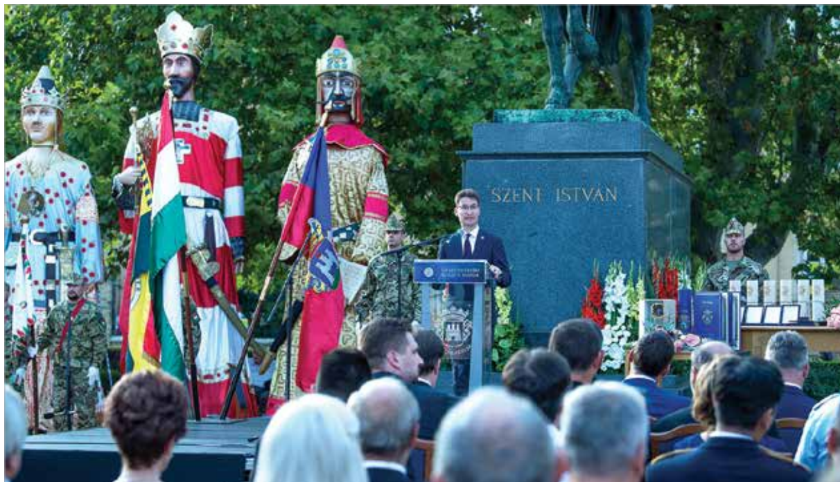
Cser-Palkovics András ünnepi beszédében a döntés felelősségét hangsúlyozta