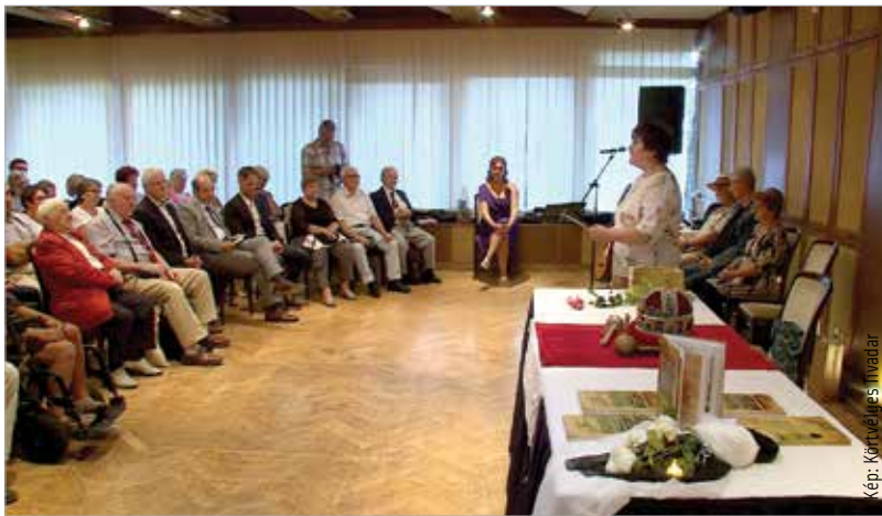
Az alkotócsoport tagjai közösen ünnepelték az ötödik évfordulót