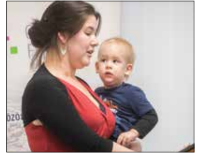
A Luca-napi hagyományokról szólt az előadás

az iparüzési adóról beszélni, emellett azonban nagyon fontos, hogy szóljunk a helyi, a mezőföldi hagyományokról!” – fogalmazott az önkormányzati képviselő. – „Ezek a hagyományok hosszú évszázadok óta meghatározzák városunk identitását, gondolkodásmódját, ezért is fontos, hogy megemlékezzünk róluk!” Ezen hagyományok közé tartozik például az is, hogy december tizenharmadikán búzát ültetünk egy kis tábla, előrevetítve ezzel a jövő évi gazdag búzatermést. Ilyen „búzafejeket” kaptak most a Lucák névnapjára ajándékként.