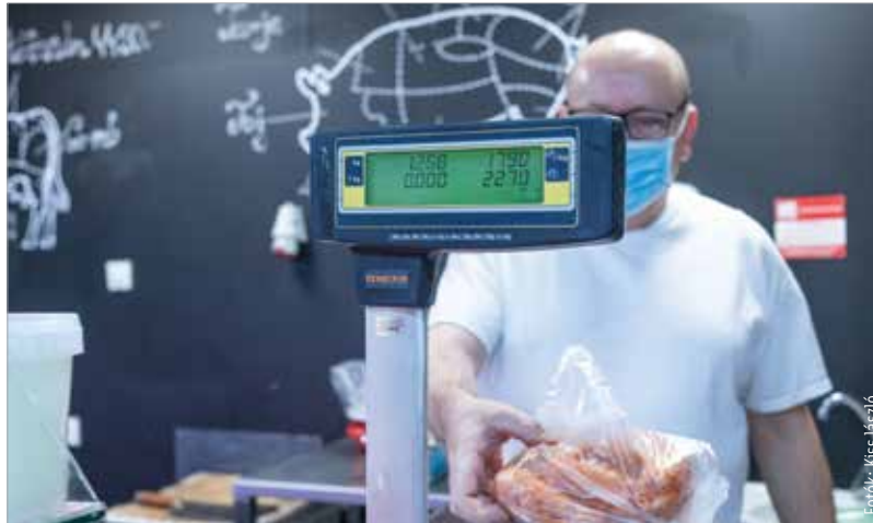
A hűskészítmények ára jóval magasabb lett