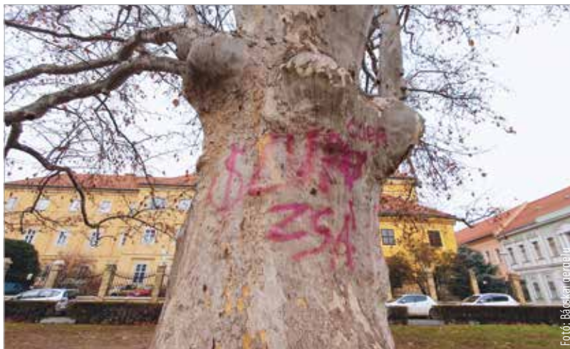
Cupa és Zsá – valaki úgy gondolta, hogy a gyönyörű, védett platánfa törzsén jól mutatnak ezek a feliratok vörössel

A felirat tehát egyelőre marad. Szerencsére a fának nem okoz kárt, ám a vizuális élmény erősen megkérdőjelezhető. És marad a nagy kérdés is: ezt miért kellett?