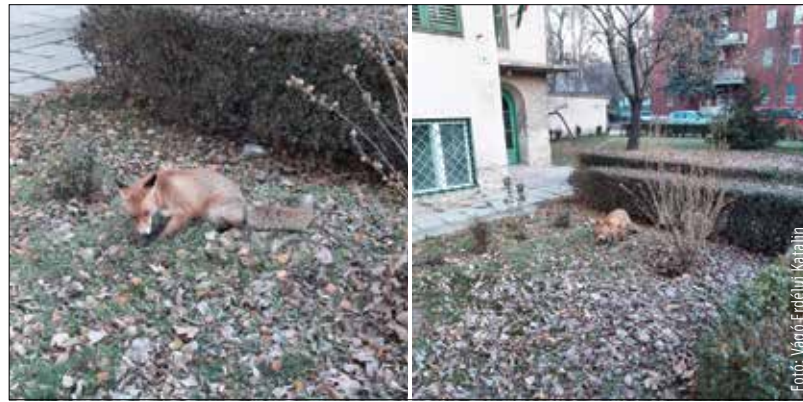
A képeken jól látható, hogy egy társasház előkertjében falatozik a róka

Hogy miért? Ha nem lövik le a rókát, hanem befogják, utána visszaviszik a természetbe. Ez nem jó, két okból sem: egyrészt ezeken a helyeken általában vadgazdálkodás folyik, másrészt mivel territoriális állatról van szó, nagy eséllyel annak a területnek már van „rökagazdája”.