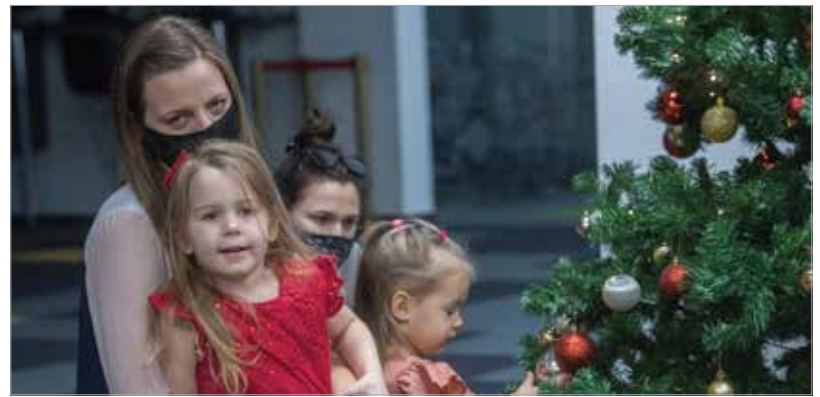
Lucák lehetnek gyermekek, édesanyák, sőt nagymamák is. A Luca-napra minden korosztályból jöttek névnaposok.