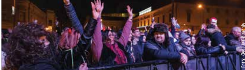
Újra hangos, népes szilveszterre számíthatunk!

pedig a hagyományos Szerencsehozó lencse rendezvénye várja majd a fehérváriakat. A programok csak védettségi igazolvánnyal látogathatók, a maszk használata ajánlott, de nem kötelező. A szilveszteri műsor részleteit idei utolsó, december 21-i lapszámunkban olvashatják!