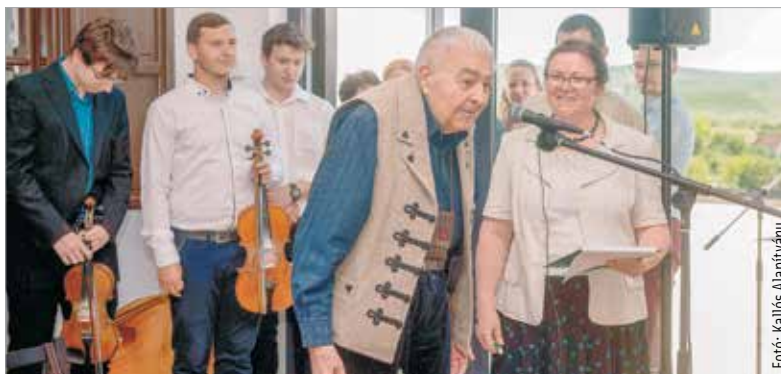
A válaszúti ifjak is rajongtak Kallós Zoltánért. Egyszerűen nem lehetett őt nem szeretni!