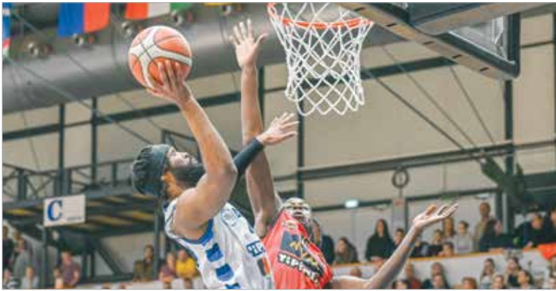
Horne tizenhárom pontot és hét lepattanót jegyzett az Oroszlány ellen

A rájátszás elérésére esélytelen oroszzlányiak nem tudtak mit kezdeni a Fehérvár hatékony védekezésével, miközben támadásban is remekeltek Vojvodák, és a szünetig már el is döntötték a meccset. Végül 97-76-ra nyertek, amivel kiegyenlítették mérlegüket a bajnokságban: tizenegy győzelemmel és ugyanennyi vereséggel áll az Alba, ami persze rosszabb mutató annál, mint amit az idény előtt vártunk. Négy fordulóval az alapszakasz vége előtt matematikailag még nem biztos, hogy bejut a legjobb nyolc közé