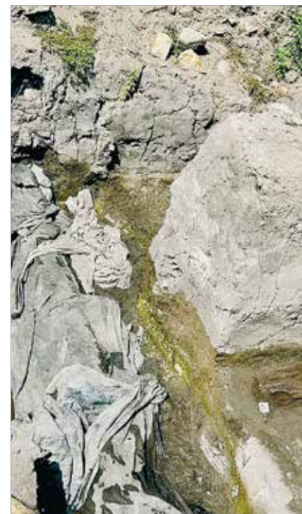
A legutolsó feltárást a Szűz Mária-koronázótemplom vizsgálat, amivel a munkálatok pontos helyét igy

Talán a legismertebb talaj mélyét kutató eszköz a fémkereső, mert sokan úgy vélik, ezekkel lehet a leggyorsabban meggazdagodni. De azt is tudjuk, hogy ez nem éppen jogkövető tevékenység. Talán akkor lett a legismertebb és legnépszerűbb, amikor a Seuso-kincsek hazatértek, és újabb nyomozások indultak meg. A múzeum munkatársai is használnak ilyen eszközöket vagy csak a fosztogatók? Azért létezik út a kettő között is! Lehet Magyarországon fémkeresőt használni, csak a feltételei vannak beszabályozva. Bárki számára elérhető, ha betartja a jogszabályi lehetőségeket, kötelezettségeket. A