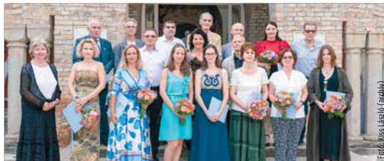
A Lánzos-Szekfű-ösztöndíj nyertesei a Bory-várnál egy korábbi átadón

szellemi értékeket teremtő, tartalmazó művészeti alkotásokkal. A pályázatokat április utolsó napjáig lehet benyújtani. Az ösztöndíjak odaítéléséről, összegéről az alapítvány kuratóriuma dönt. Kedvező elbírálás esetén az ösztöndíj átadását követően utalják át a megítélt összeg ötven százalékát, míg a másik felét a pályamunka elfogadását követően fizetik ki. A támogatás adómentes. A díjat hagyományosan az augusztus huszadikai ünnepségekhez kapcsolódó nyilvános kuratóriumi ülésen adják át. (Forrás: ÖKK)