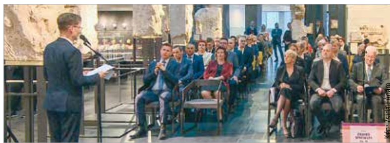
Székesfehérvár polgármestere az impozáns látogatóközpontban köszöntötte a lengyel vendégeket