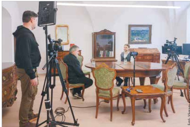
A főigazgatóval múzeumi dolgozósobájában beszélgettünk

Mi nem is akarunk mindent feltúrni! Sokszor jobban örülünk annak, ha ott marad a föld alatt az, ami oda való, hiszen ott van a legnagyobb biztonságban, amit sokan vitatnak. Ha elhatározzuk magunkat egy feltárára, akkor egyben óriási felelősséget is vállalunk az állagmegóvára, hogy mi történik például egy kőfallal, egy épületrésszel. A feltárt építmények nem maradhatnak az enyészeté, csak mert felfedtük. Amíg a föld alatt vannak, addig biztonságban tudhatók. Székesfehérvár belvárosának szerkezete, a városfal – ami