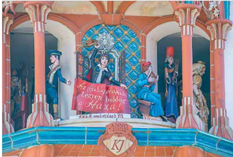
Az Órajáték a diákság tiszteletére májusban egy hónapon keresztül a Gaudeamus Igitur dallamát, valamint egy sárospataki diákdalt játszik, a történelmi figurák helyett pedig az iskolai élethez kötődő személyek vonulnak fel

tuk keresztül minden tanárnak köszönetet mondanak az elhivatottságukért, ami nélkül a diákok nem juthattak volna el a ballagásig, és nem készülhetnének az érettségire, a szakmai vizsgára, a felvételire.