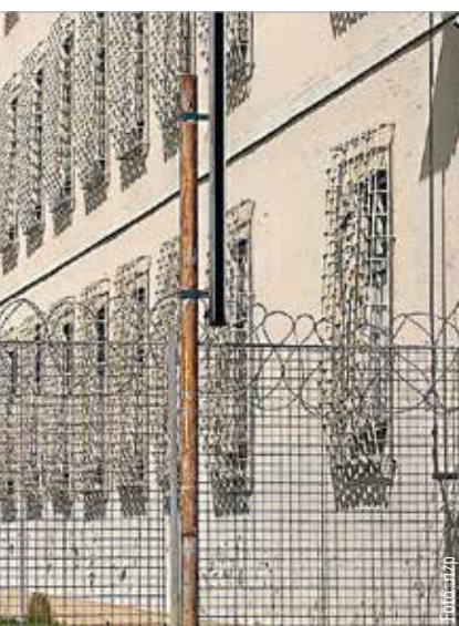
tarjáni társa, valamint korábban Hóman Bálint. Között halt meg 1951-ben.

És még mennyi meggyalázott élet, mennyi sőtört család szenvedhetett a szétégett mélyén, amit egy sunyi világhatalom hozott e népre? Ponyi Józsefnek, Józsi bácsinak köszönjük a nyitottságot, amit azért írtunk elénk, mert pár héttel ezelőtt írtunk egykori miniszterünkről, Hóman Bálintról!