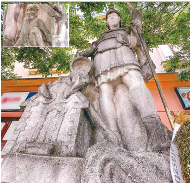
A fehérvári Szent Flórián szobor az egykori belvárosi tűzoltólaktanya helyén óvja a várost a veszedelmes tüzeiktől, de a szobor hátulján ott lappang a tüzek ördöge is

Szent Flórián napján a fazekasok és kovácsok nem dolgoztak, de a hiedelem szerint e napon asszony nem gyújthatott tüzet. A férfinak e napon kézmosást követően lehet a házba lépni, s a vizet szertefröcskölni, hogy a veszedelmet elűzze. Egyébként nem tartottak szünetet Flóriánkor, ezért dolgos napnak is mondták.