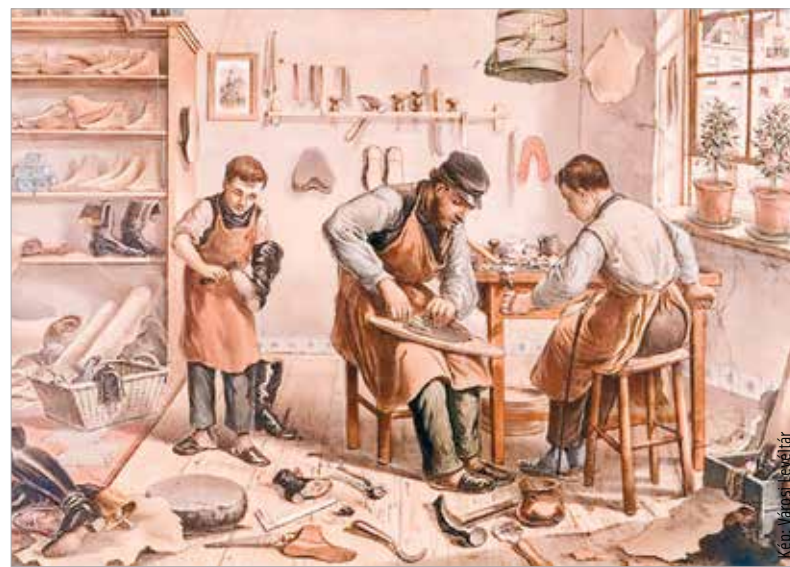
A 19. század közepére a legnépesebb céhe a csizmadiáknak volt Fehérváron, kétszáz mester, száznegyvenkilenc segéd és hetvenöt tanonc

No de ki lehetett mester egyáltalán. Aki megkezdte a szakmát, azt csak inasnak szólították, és mester mel-