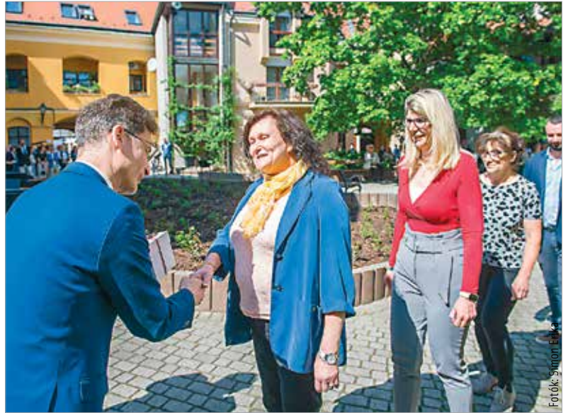
A város kis ajándékokkal köszönte meg a most ballagó osztályok osztályfőnökeinek a vállalt és elvégzett feladatokat

Cser-Palkovics András polgármester és Mészáros Attila alpolgármester adta át az osztályfőnököknek. A búcsúzó eseményen a polgármester köszöntőjében felidézte, hogyan alakult ki és bővült egyhetes eseménnyé a ballagás köré szervezett programok sokasága. Hangsúlyozta, több mint tíz éve él a hagyomány, melynek során a végzős osztályfőnököknek, az intézményvezetőknek és raj-