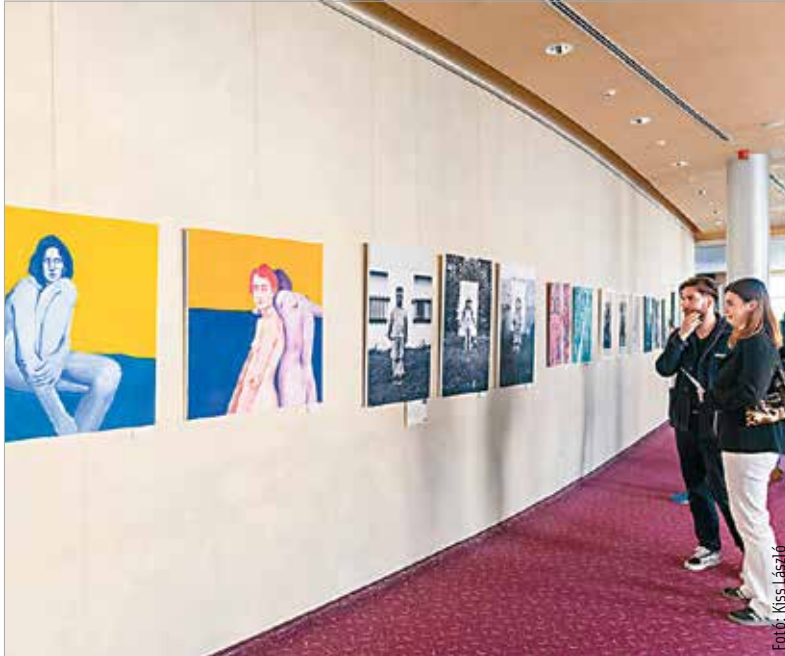
A Kondor Kör ma is segíti a fiatal képzőművészeket