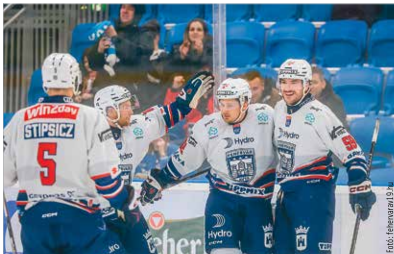
Két győzelemre készül a Volán, de egyik meccsén sem lesz egyszerű dolga

lással” találkozik az elődöntőben. Pikáns csata várható remek hangulatban szombaton 17 órakor! Előtte, 13.30-kor az FTC a DVTK csapatával mérkőzik, és a két elődöntő győztese vasárnap 17 órakor csap össze a döntőben. Ahol tehát biztosan lesz fehérvári részvevő (akárcsak aznap fél kettőkor a bronzmeccsen), a kérdés csak annyi, meg tudja-e lepni az osztrák ligából érkező Volánt az akadémiai „kis testvér”. A fehérvári házi rangadó most először jött össze tétmeccsen, amit mindenképpen érdemes lesz megnézni szombaton kora este!