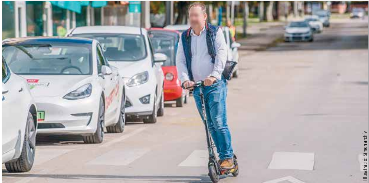
Vége szabályok közé szorítják a rolleres közlekedést is!

Mint írta, az elmúlt fél évszázadban nagyot változott a világ: megnőtt az úthálózat, a városi közlekedés zsúfoltabbá és összetettebbé vált, hatalmas technológiai fejlődés ment végbe a járműiparban, többszörösére emelkedett a járművek száma és új közlekedési eszközök jelentek meg. De ötven év alatt sokat változtunk mi, közlekedők is. Az élet felgyorsult, többen és