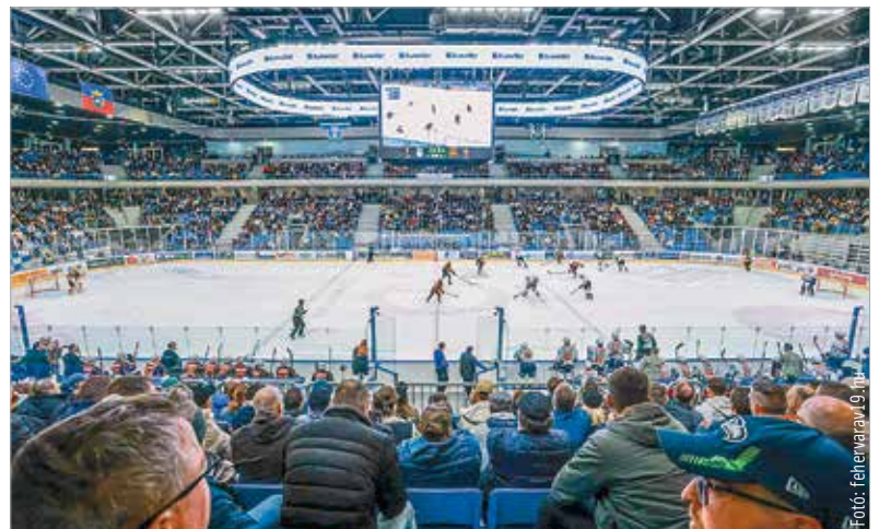
Az idény végén nem volt ritka a telt ház a MET Arénában

végül „kisöpörte” a Volánt. Az első meccs még szoros volt, de ezúttal nem hozott idegenbéli bravúrt a Fehérvár, itthon pedig bár nagyot küzdött, szintén két vereséget szenvedett el. Húsvét vasárnapján 5-1-re nyert a Graz, ezzel véget ért a mieink szezónja. Bár korábban még az a veszély is fenyegetett, hogy a rájátszásba sem jut be a Volán, végül a közönség is díjazta a hajrában mutatott hozzáállást. A csapat most csütörtökön a MET Arénában egy szurkolói ankkal köszön el a szezontól, a válogatott játékosok pedig készülnek a világbajnokságra.