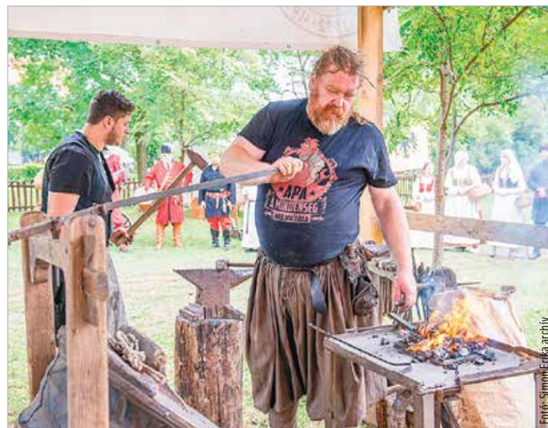
A paraszat ebben az évben is felszítják a Rác utcában

A rendezvényen előadások hangzanak el, bemutatók lesznek, melyek mind a népi kézművességhez, hagyományokhoz kapcsolódnak, miközben az utca teljes hosszában késkészítő mesterek mutatják majd be portékáikat.