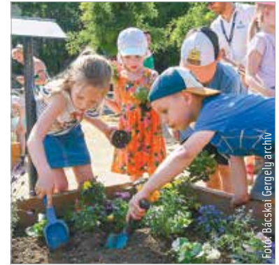
A kiskertek május harmincegyedikéig lesznek láthatók a Zichy ligetben, utána az óvodák udvarára költöznek, ahol a gyerekek gondozzák őket