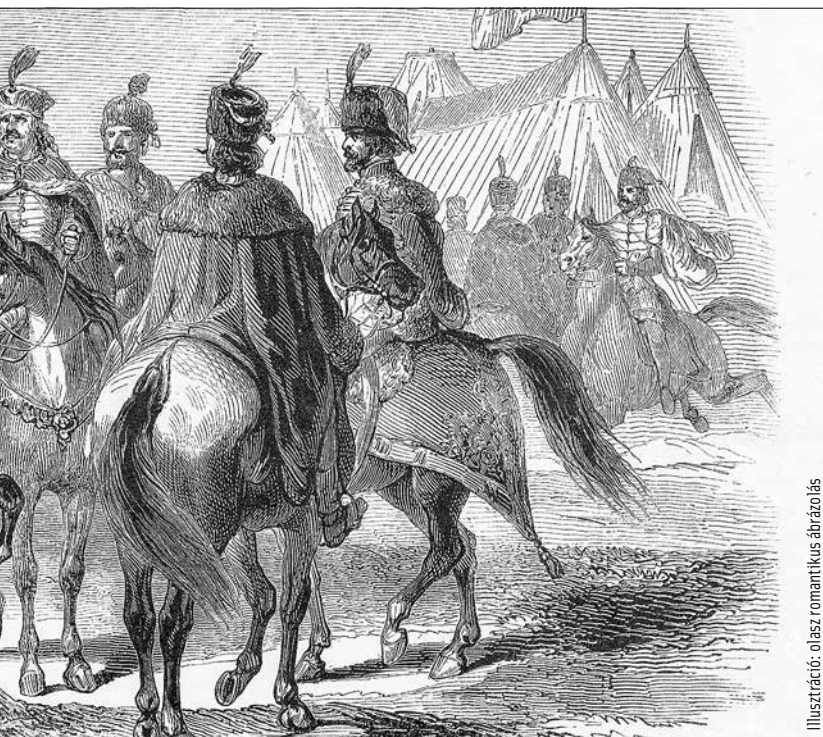
Illusztráció: olasz romantikus ábrázolás

többé király nem lehet idegen személy, csak született magyar