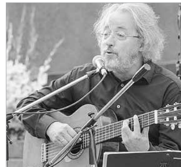
Sebő Ferenc (1947–2026)

Elhunyt Sebő Ferenc előadóművész, zeneszerző, a táncházmozgalom egyik elindítója. A Kossuth-díjas művész idén februárban töltötte be hetvenkilencedik életévét. Többször játszott az elmúlt években is Székesfehérváron, és a városban kezdte gimnáziumi tanulmányait is.