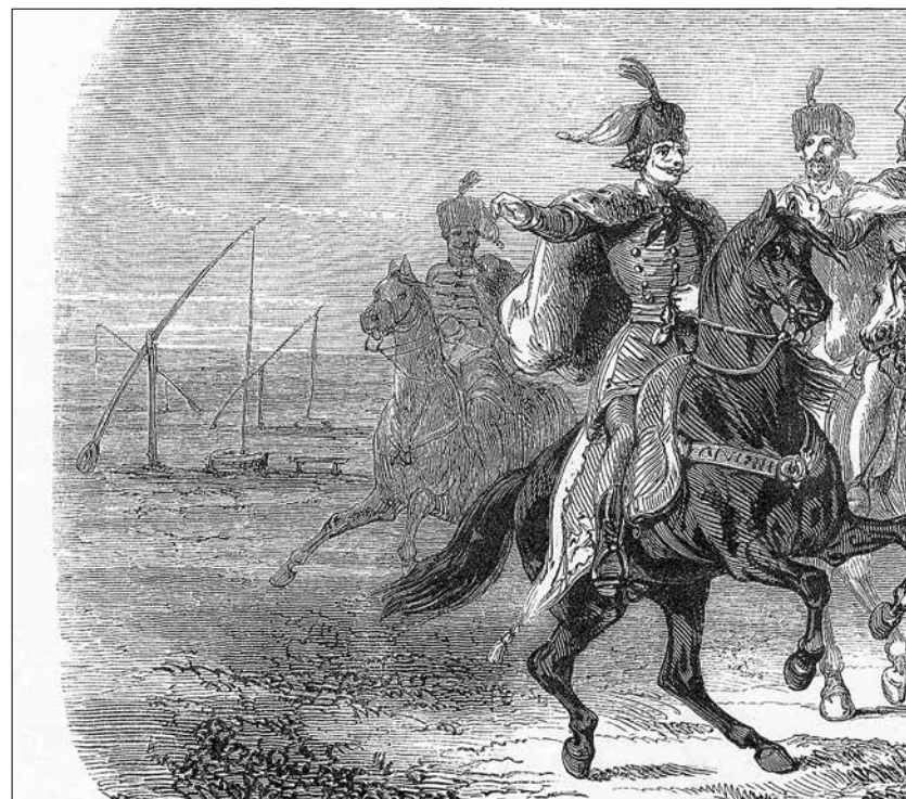
Az 1505-ös rákosmezei országgyűlés mondta ki, hogy II. Ulászló király (II. Lajos apja) halála után