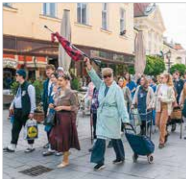
Olyan hosszú volt a sor, hogy amíg az eleje a Magyar Király szálló előtti térre ért, még sokan a Fő utcán sétáltak