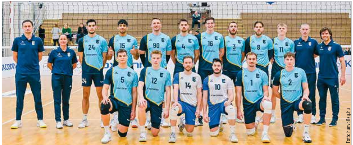
A hazai pálya előnye és egy remek alapszakasz is a MÁV Előre mellett szól a finálénak