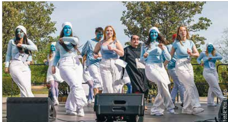
A hupikék törpikék Hókuszpókkal együtt táncoltak

A ballagási hét szombaton kilenc órakor a városi ballagással folytatódik: a Városház téren huszonegy iskola nyolcvanöt osztályának kétezzer-hatvanöt diákja búcsúzik. A hétvége után pedig kezdődik az érettségi időszaka az írásbelikkel: május negyedikén, hétfőn matematikából, kedden matematikából, szerdán pedig történelemből vizsgáznak a diákok.