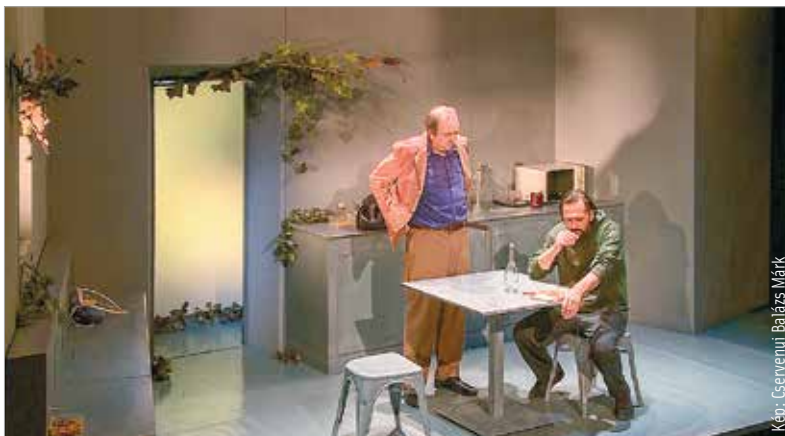
A Vörösmarty Színház előadása nem ígér könnyű szórakozást, de kíméletlen őszinteséggel és kiváló színészi játékkal mutatja be a kortárs magyar drámaíródalom egyik legfontosabb történetét

mindenki az elvágyódás és a tehetetlenség csapdájában vergődik: az önfeláldozó testvér, a humorral védekező szomszéd és a hivatását vesztett orvos alakja rajzolja ki a közösség drámáját. A Botos Bálint rendezésében megvalósuló produkció különlegessége, hogy a sötét témák – mint az öngyilkosság és a kilátástalanság – ellenére a nézőteret gyakran nevetés tölti meg. Ez a sirva vigadás adja meg az előadás igazi erejét, görbe tükröt tartva a nézők elé.