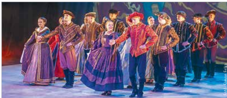
A színpadon Szent István, Mátyás király és Mújkó, Wathay Ferenc és Varkocs György, Petőfi, az első világháborús emlékművek, végül pedig Kati néni szobra köré koreografált táncokkal jelenítették meg a magyarság évezredes történelmét