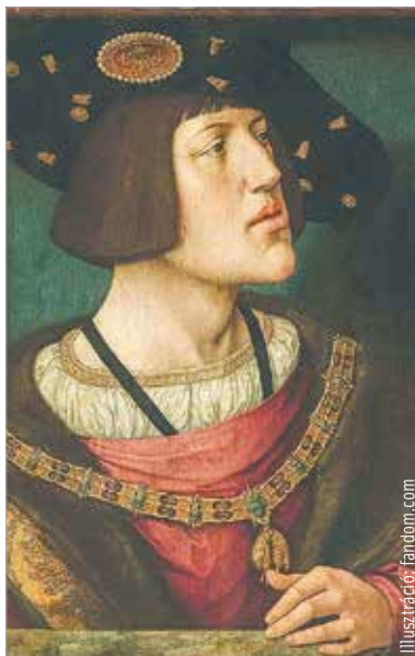
Habsburg Károly 1519. június huszonnyolcadikán lett német-római császár. Nagy álma egy egyetemes keresztény birodalom volt, amellyel megállíthatta volna I. Szulejmán szultán terjeszkedését, de erejét lekötötte a protestáns reformáció és a franciákkal vívott itáliai harcok egész sora.

Természetesen Magyarországon is működtek a török kémek. 1526. május negyediken így ír Burgio pápai követ Budáról: a király a köznemesség megbízottaival titkosan akar tárgyalni az ország dolgairól. Erre a sok kém miatt van szükség, akik a nyilvános tárgyalásokon mindenhová beférkőznek. Szerémi György is úgy vélekedett, hogy Magyarország romlásának egyik oka az országot teljesen behálózó török kémhálózat. Egyes vélemények szerint a török az barbár, csak a köny-