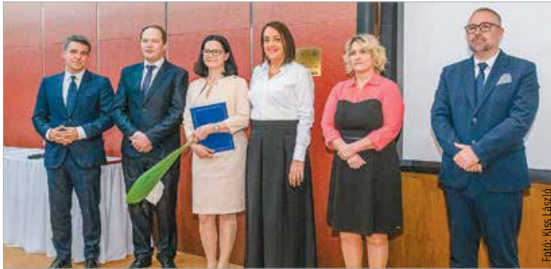
A Szent György-napi ünnepségen számos kitüntetés és díj talált gazdára