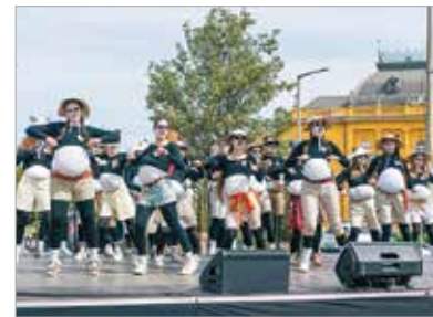
A több mint nyolcszáz végzős diák táncolva, zenélve, énekelve, integetve csalt mosolyt a belvárosban sétálók arcára. Az idei Bolondballagáson Kung Fu Pandák, szökött rabok és decens nyugdíjasnak öltözött fiatalok lepték el a fehérvári utcákat.