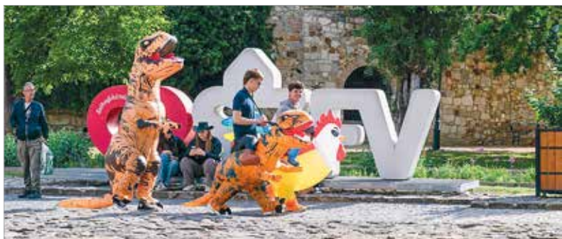
Fehérvár mindig visszavárja a kirepült diákokat!