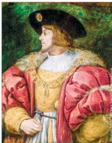
II. Lajost kétévesen Székesfehérváron koronázták meg 1508. június negyedikén, majd tízévesen foglalta el a trónt

A király felülvizsgáltatta Thurzó Elek 1522-23-as kincstartói működését. Megállapították, hogy nevezett nem számolt el az ural-